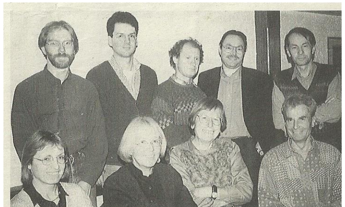
Kandidaten von BÜNDNIS90/DIE GRÜNEN für den Weilheimer Stadtrat